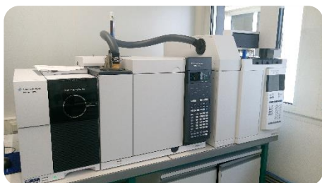
Analyse par headspace couplée à la chromatographie gazeuse

UNE PRESTATION ADAPTÉE LIÉE À L'INSTRUCTION DGS/EA4 N° 2012-366 du 18 Octobre 2012